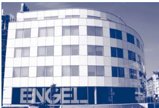
ENGEL CZ s.r.o.

tizované školící prostory s multimediálním vybavením zajišťují maximální efektivitu prováděných školení. Stroj s robotem se nachází přímo ve školící místnosti, takže je možno výklad spojit s okamžitými praktickými ukázkami na stroji.