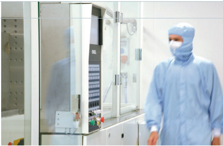
Die Medizintechnik hat inzwischen wieder Fahrt aufgenommen

weitere Steigerungsraten von ca. 5 % in den nächsten Jahren zu erwarten sind, dürfte sich die Lage im Marktsegment Verpackung erst ab Sommer 2010 bessern, da sich aufgrund der gestiegenen Arbeitslosigkeit die Konsumneigung nicht so rasch erholen wird.