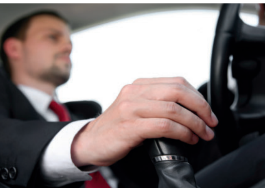
Die Automobilindustrie legte mit einem Minus von knapp 70 % den Rückwärtsgang ein

Marktentwicklung 2009. Der Markt für Spritzgießmaschinen ist im vergangenen Jahr dramatisch eingebrochen. Auch mit einem zeitlichen Abstand von mehreren Monaten wirken die Zahlen noch erschreckend. Die Analyse eines Betroffenen.